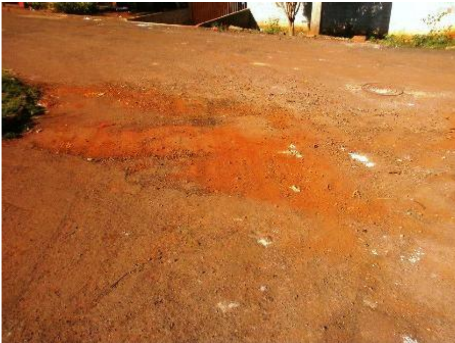
Asfalto em via pública no Jardim Aeroporto

Os vereadores de Campo Mourão continuam indicando para a Prefeitura inúmeras ruas e avenidas nos mais diferentes pontos da área urbana que necessitam, com urgência, de serviço de recapeamento ou tapa-buraco. Também têm apresentado inúmeras proposições para que a administração municipal providencie o asfaltamento de vias públicas na periferia, onde a população pede a melhoria.