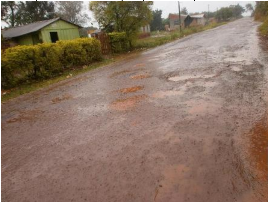
Rua com antipó na Vila Guarujá