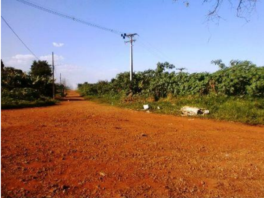
Rua sem asfalto Jardim Tropical