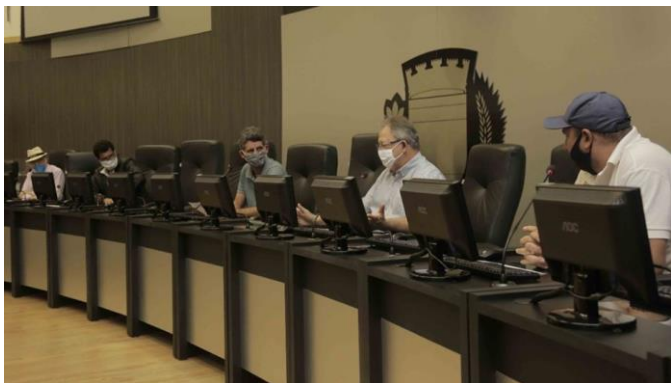
Reunião da mesa diretora da Câmara Municipal.