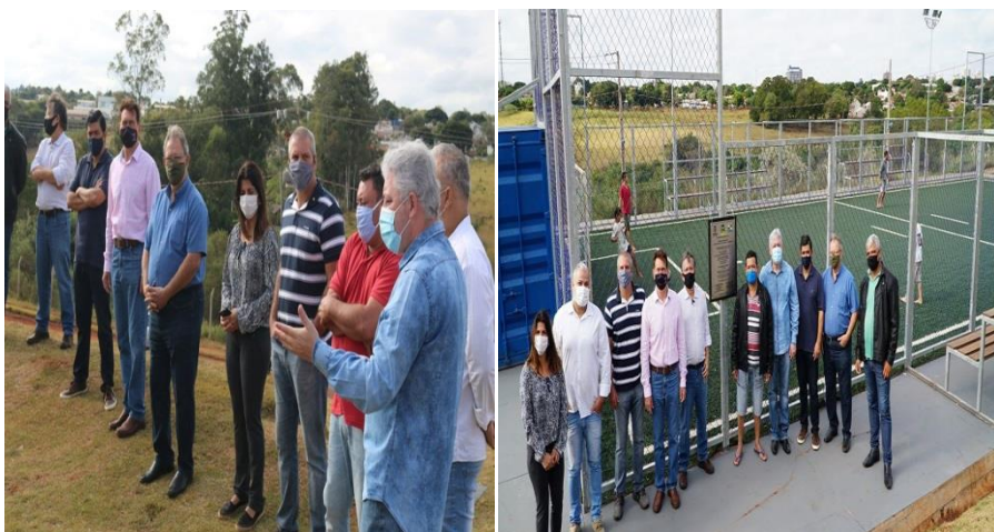
Estive no Conjunto Fortunato Perdoncini, onde o município fez a entrega oficial da reforma do Centro comunitário da mini arena esportiva à comunidade.