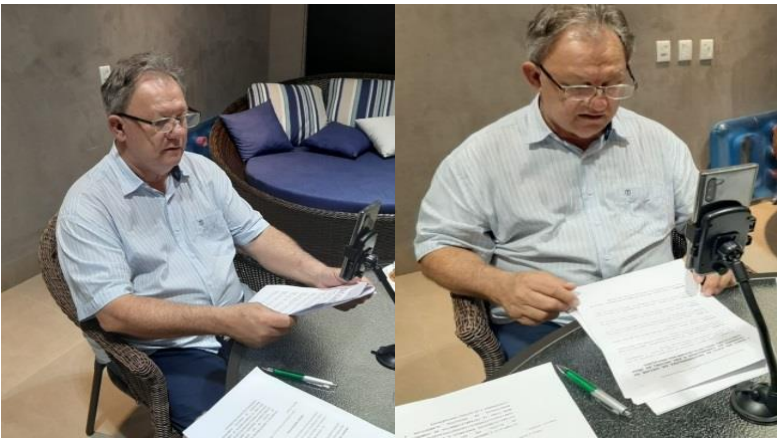
Sessão da Câmara Municipal, transmitida ao vivo a todos pelo You Tube.