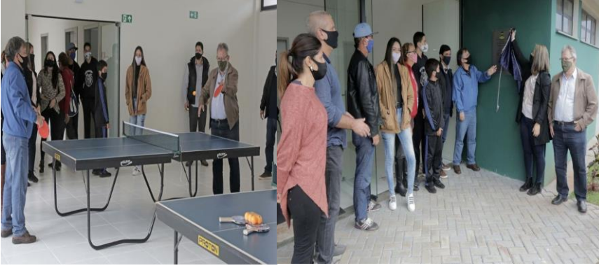
Inauguração do centro de treinamento de artes marciais e tênis de mesa.