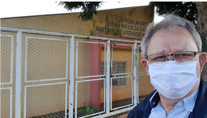
Visitei o Jardim Paulino, entre outros lugares passei pelo CMEI Nossa Senhora de Fátima, onde falei com algumas professoras que estavam preparando material para as crianças trabalharem durante o período de pandemia em suas casas.