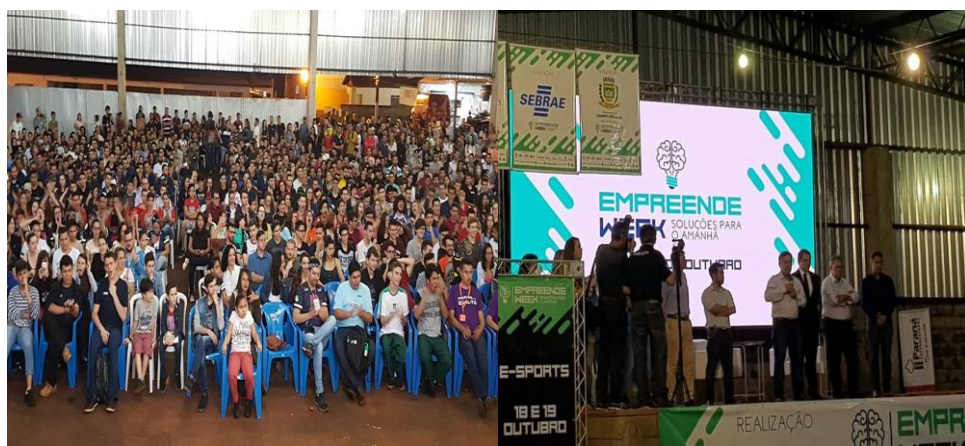
Abertura oficial do Empreende Week 2018.