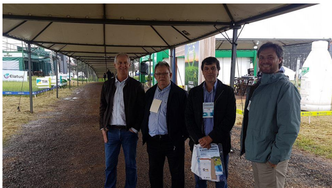
Visitando o Winter Show de inverno da Cooperativa Agrária em Colônia Vitória, Entre Rios, Município de Guarapuava.