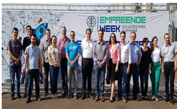
Particpei da reunião da Câmara de Indústria, Tecnologia e Inovação do CODECAM e, em seguida, visitei o barracão de exposição do Empreende Week.