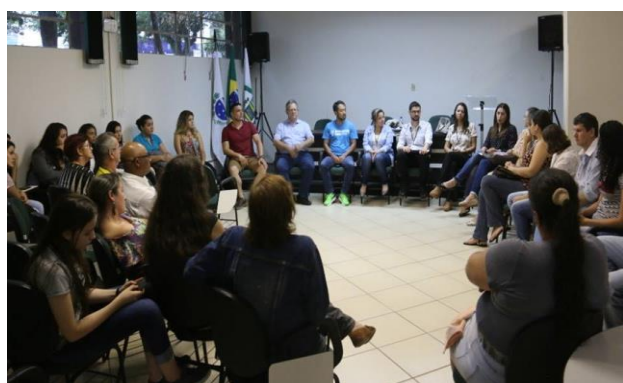
Roda de conversa com os microempreendedores Individuais (MEI) que atuam na área de alimentos, realizada no mini-auditório da prefeitura. A ação faz parte do projeto Comendo-Bem, uma parceria da UTFPR com a Prefeitura de Campo Mourão.