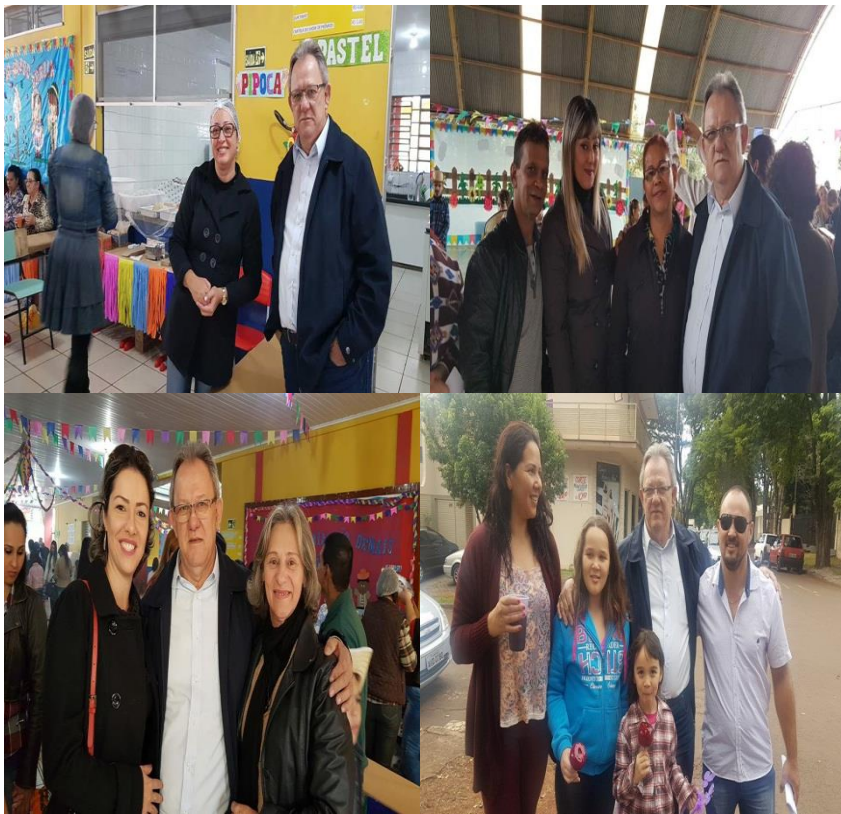
Festa junina da Escola Manoel Bandeira e CMEI São José, no Jardim Alvorada/Bandeirantes.