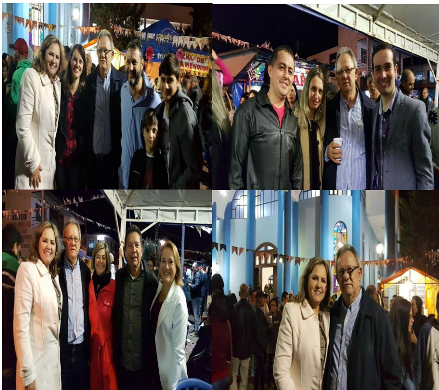
Missa caipira e Festa junina do Santuário Nossa Senhora Aparecida.