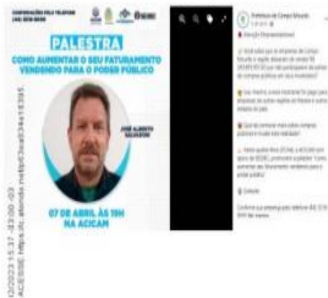
Imagem 1 – Divulgação de palestra sobre compras públicas