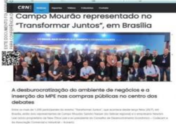
Imagem 3 – Divulgação de participação em evento sobre compras públicas