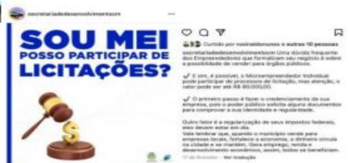
Imagem 4 – Estímulo para MEI's na participação de compras públicas