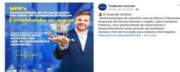
Imagem 5 – Evento sobre compras públicas – estímulo para as micros e pequenas empresas durante a pandemia