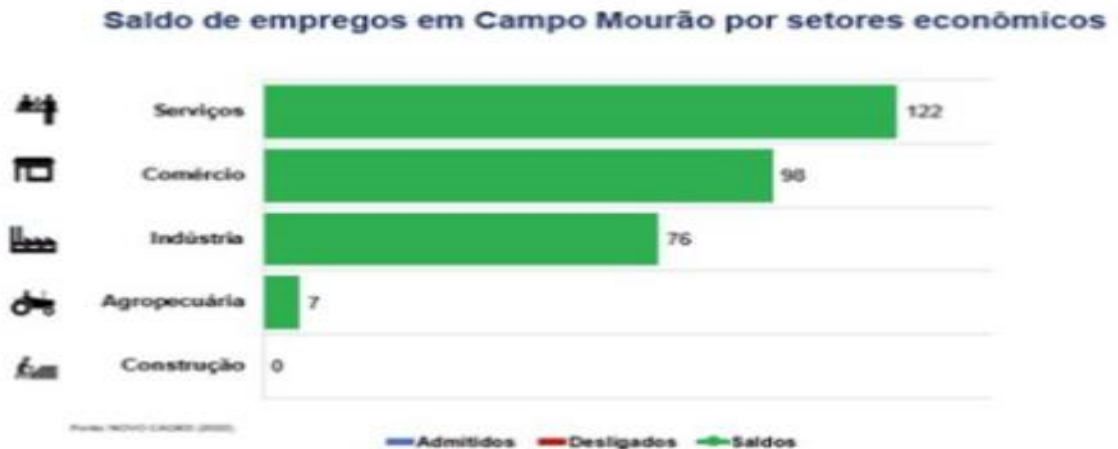
Gráfico 1 – Saldo de emprego em Campo Mourão – Fevereiro/2022.