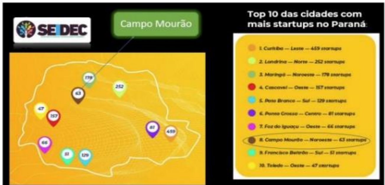
Figura 1 – Top 10 das cidades com mais startups no Paraná